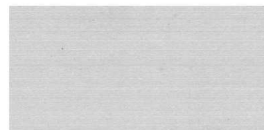
Bc. Lukáš Krejčí Bc. Lukáš Krejčí L-K construct podnájomca